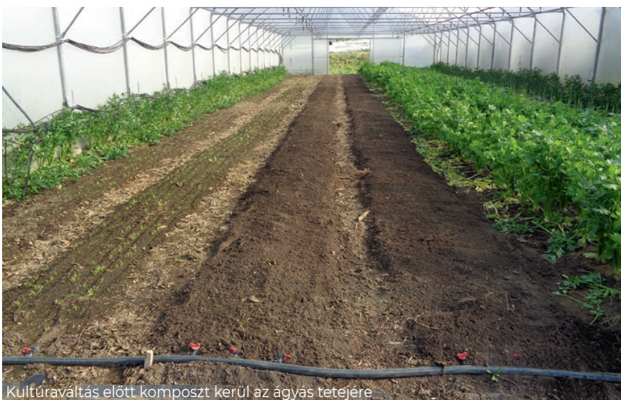
Kultúraváltás előtt komposzt kerül az ágyás tetejére