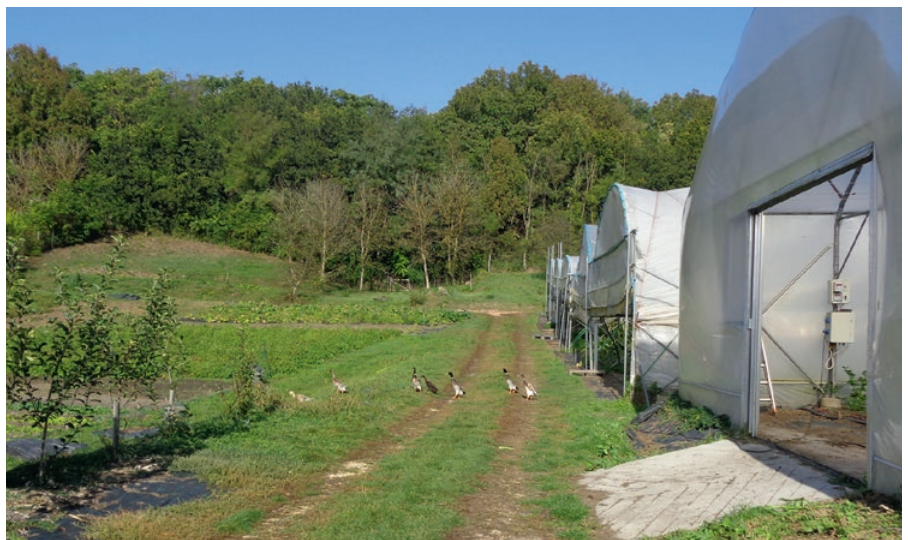
Az indiai futókacsák eredményesen gyérik a spanyol meztelencsigákat

rábbi tagok újra jelentkeznek. A fennmaradó helyeket pedig a várólistán szereplő jelentkezőkkel tudják feltölteni. Ezután mindenki megkapja a gazdaság egyéves költségvetését, amibe minden állandó (beleértve az alkalmazottak munkabéretét) és várható költséget beleszámolnak (ez a többéves tapasztalatuk alapján már könnyebben megy, mint a kezdetekkor), és elosztják egyenlő arányban, majd ebből havidíjat számítanak. Vannak több és kevesebb főből álló „részesedők”, családok, baráti közösségek. Mindenki a méretek arányában leosztott díjat fizeti előre havonta, illetve két- vagy háromhavonta. De van, aki már tavasszal előre kifizeti a teljes éves hozzájárulást.